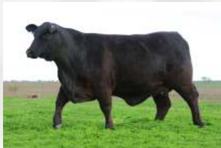
BT Junco 1293/19