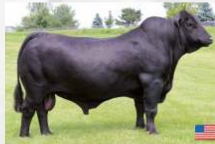
Suhn's Final Cut 894C33